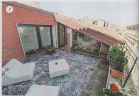
6. Maseria Salinola a Ostuni (BR): su Volagratis.com , 3 notti per 2 persone a € 480. 7. Loft per famiglie a Catania (€ 160 a notte per 6 persone su Vrbo.com ).

hotel". Aggiungici che l'autunno è la stagione ideale per partecipare a uno dei tour enogastronomici alla scoperta dello street food locale (da € 45 con sicilydaybyday.com ), e la staycation è bell'e servita.