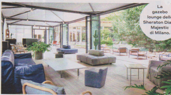
La gazebo lounge dello Sheraton Diana Majestic di Milano.

charme come Corte Verzé (doppie da € 100 a notte, corteverze.it ). Se invece preferisci temperature più miti, puoi optare per la Basilicata, per una full immersion di sapori lucani a Bernalda, borgo d'altri tempi nonché buen retiro del regista Francis Ford Coppola (doppie da € 100 nell'incantevole hotel diffuso Borgo San Gaetano, borgosangaetano.com ) o ancora per la Puglia: tra la Valle d'Itria e l'alto Salento, ad esempio, per cimentarti nella raccolta delle olive e goderti, per un paio di giorni, un distanziamento sociale "bucolico" in una delle masserie della zona.