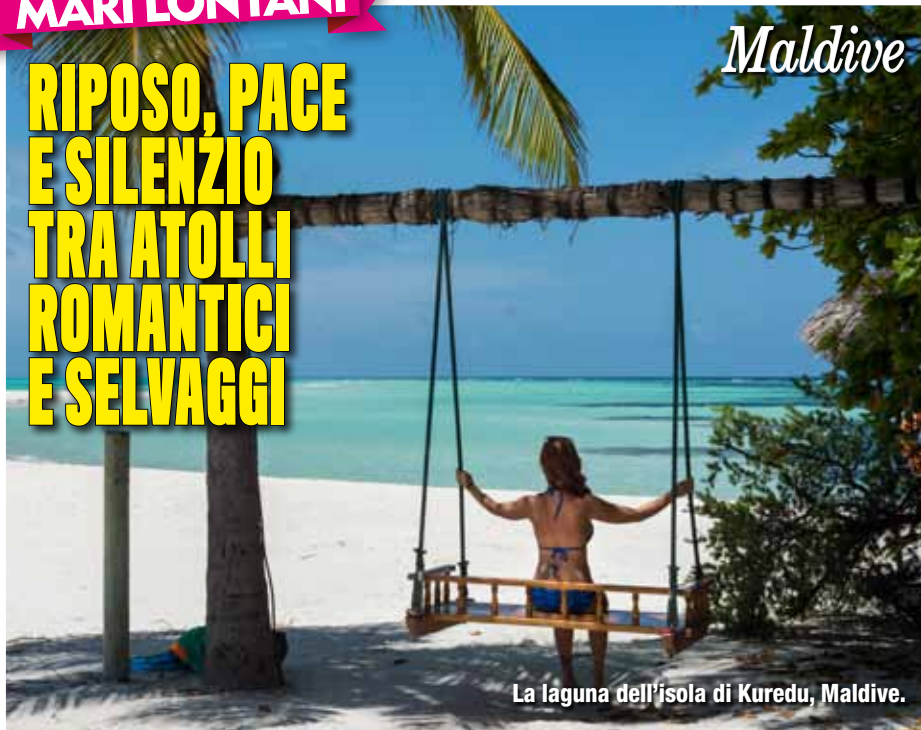
La laguna dell'isola di Kuredu, Maldive.

P iccoli isolotti, acqua limpida e fondali ricchi di pesci e coralli. Le Maldive sono la meta da sogno per chi desidera una vacanza lontano dal mondo frenetico e a contatto con la natura. Destinazione ideale per chi vuole recuperare le energie, offre anche molte attività per chi non ama stare fermo. Dallo snorkeling con pinne e maschera in cerca di tartarughe e pesci pagliaccio ai giri in canoa: qui annoiarsi è impossibile! I tour in barca ti permetteranno di scoprire anche le isole più incontaminate, di goderti tramonti dai colori accesi e di pranzare con il pesce appena pescato.