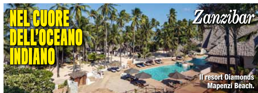
Il resort Diamonds Mapeenzi Beach.

Q uest'isola è la perla dell'Oceano Indiano. Zanzibar, infatti, è celebre per la bellezza delle sue spiagge con la sabbia fine e bianchissima, il mare trasparente, la natura paradisiaca e le sue tradizioni uniche, nate dall'influenza delle culture delle diverse popolazioni che si sono susseguite. Nonostante sia meta ambita dai turisti ormai da tempo, rimane un luogo con zone ancora del tutto incontaminate.