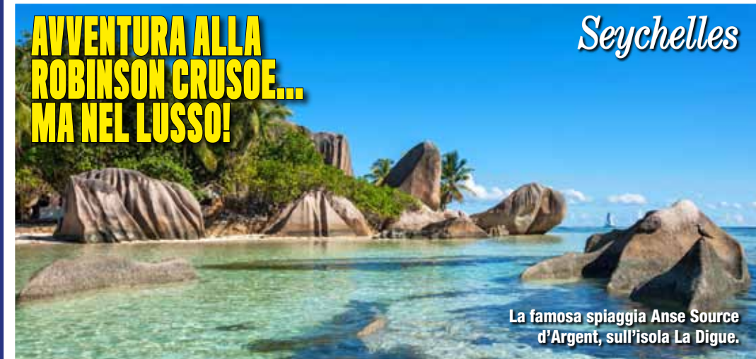
La famosa spiaggia Anse Source d'Argent, sull'isola La Digue.

S e sogni un paradiso tropicale lussureggiante con spiagge di sabbia fine e rocce disegnate dal mare, le Seychelles sono la tua meta. Situate nell'oceano Indiano, al largo