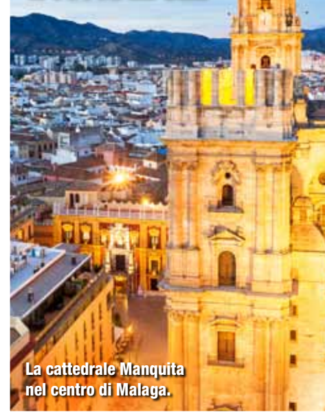
La cattedrale Manquita nel centro di Malaga.

F acilmente raggiungibile dall'Italia, economica e con tante opportunità di relax e divertimento. La Spagna è la meta ideale se hai voglia di evadere senza allontanarti troppo da casa. Se oltre al mare ti appassionano la storia e la cultura, scegli una città come Malaga, sulla costa a sud, dove potrai visitare fortezze e cattedrali. Appassionato di windsurf e sport acquatici? La tua meta è Fuerteventura con le sue spiagge vulcaniche di sabbia scura. Se invece preferisci i paesaggi punteggiati da casette bianche, la destinazione che fa per te è Maiorca, la più grande isola delle Baleari.