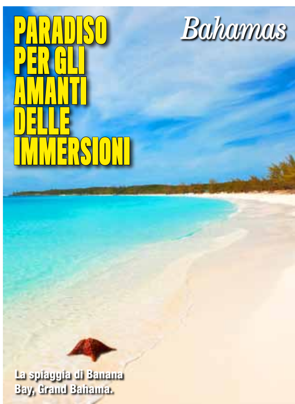
La spiaggia di Banana Bay, Grand Bahama.

L e Bahamas sono un arcipelago di 700 isole coralline al largo delle coste della Florida, di cui soltanto trenta sono abitate. Offrono un mare dalle mille sfumature, che ospita alcune delle più belle barriere del mondo e migliaia di specie di pesci. Un paradiso con una natura selvaggia, adatto per trascorrere vacanze all'ombra di palme tropicali e meta perfetta per tutti i subacquei, che possono ammirare non solo una ricca fauna acquatica, ma anche relitti, grotte e le cosiddette blue hole, profonde e misteriose caverne sottomarine. Uno scenario indimenticabile.